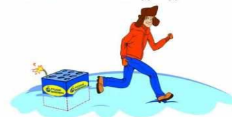
Быстро удались, не оборачиваясь!

ИСПОЛЬЗОВАНИЕ ПИРОТЕХНИКИ: Не вскрывать упаковку и не пользоваться данными изделиями в помещении (квартире, балконе, подъезде) Не носить в кармане, тем более не класть подобный товар во внутренний карман верхней одежды. Запускать пиротехнику имеет право только взрослый совершеннолетний человек. Перед запуском необходимо уточнить длину фитиля. Должен быть не менее 20 мм, иначе может не хватить времени уйти на безопасное расстояние от фейерверка. После просмотра салюта, прежде чем приблизиться к отработавшему изделию, нужно выждать некоторое время. Обычно достаточно 15 минут, дайте упаковке от салюта остыть. Не собирайте остатки ракет сразу, не исключен взрыв не разорвавшихся снарядов в ваших руках. Не стоит доверять запуск салюта детям или людям, находящимся в нетрезвом состоянии. Используйте для этого мероприятия специальную открытую площадку, вдали от большого скопления людей. Если ее нет, то отойдите на безопасное расстояние от деревьев, машин и линий электропередач.