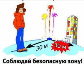
Соблюдай безопасную зону!