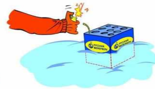
Не наклоняйся над изделием!